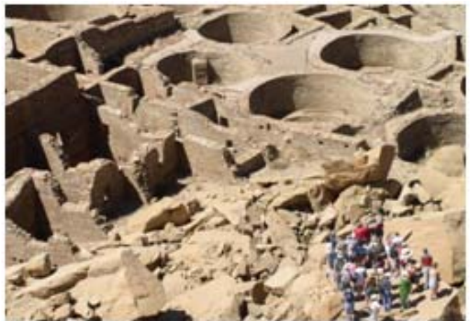
사진 6. Pueblo Bonito의 Kiva에 관한 설명을 듣는 관광객.