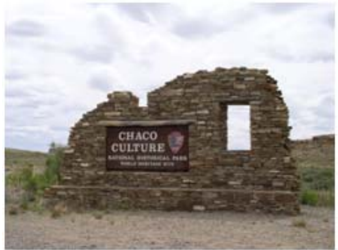
사진 1. 차코문화국립역사공원 입구의 Sign

국립공원중에서 아주 특이한 곳이다. 이 공원은 역사 공원이라고 부르는 만큼 시간의 공간을 넘어야하는 공원이다. 약 천년전의 역사속으로 들어가서 유적을 보며 옛날의 문화를 생각하게 하는 공원이다. 또한 이 공원은 지역적으로도 외지고 먼곳에 있다. 공원으로 들어가는16마일의 도로는 포장도 안되어 있어 교통이 불편한것까지 겹치니 더 먼곳같이 느껴진다. 시간과 공간 두가지 모두가 멀게 느껴지는 이곳을 관광지로 소개하는 까닭은 이곳에는 너무나 많은 신비스런 비밀이 숨겨져 있는 까닭이다.