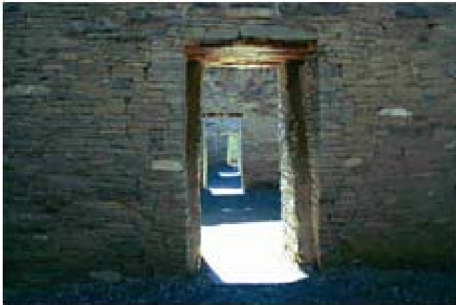
사진 7. Pueblo Bonito의 유명한 방과 방사이를 잇는 연속 된 문들.

* 위키백과 백과 사전: en.wikipedia.org/wiki/Chaco_Culture_National_Historical_Park