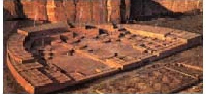
사진5. Pueblo Bonito의 상상도.

혼자 구경할 수도 있다. 반달모양이라 할 수도 있고 "D" 글자 모양이라고도 할 수 있는 설계로 지었다고 말할 수 있다. 그림 2에는 1000년전 본래의 Pueblo Bonito를 상상해서 그린 그림이다. 건물의 배치가 남향이 되도록 지었는데 반원의 직경부분이 되는 전면의 벽이 춘분과 추분때의 해뜨는 지점과 해지는 지점을 이은선에 일치하게 배치를 했다고 한다. 이 건물은 주택지로 쓰인 것은 아니고 종교적 또는 정치적 목적으로 쓰여진 건물로 추정한다고 한다.