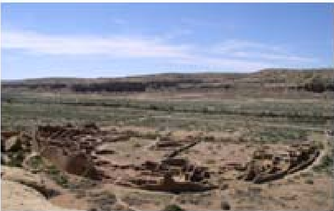
사진 4. Pueblo Bonito의 전경.

Visitor Center 앞 주차장에서 걸어갈 수 있는 가까운 거리에 있는 유적지로서 약 150개의 방과 다섯개의 Kiva를 가진 곳이다. 발굴을 하지 않은 상태의 유적지로 대표적인 모습을 여기서 볼 수 있다.