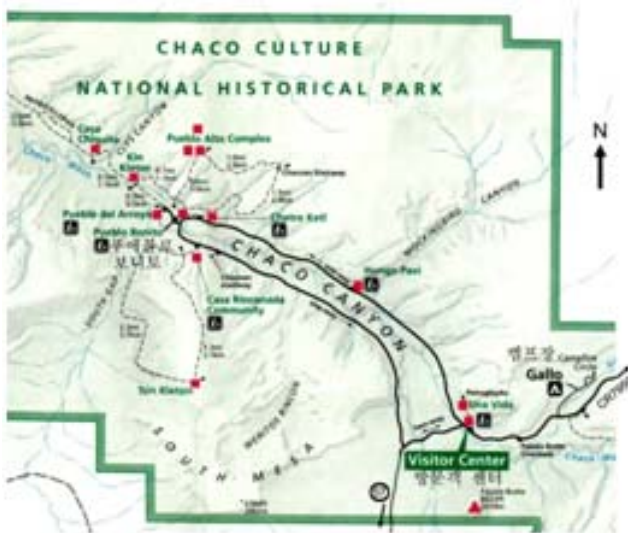
그림 1. 공원내의 중요 유적지와 Trail

그러나 1150년경 부터 계속되는 가뭄으로 말마암아 아나사지 인디언들은 살기가 어려워지자 이곳을 버리고 생활여건이 좋은곳으로 떠나기 시작했다. 현재의 나바호(Navajo), 주니(Zuni), 푸에블로(Pueblo) 인디언이 살고 있는 지역으로 이동한것 같다고 한다. 그후 차코 케년은 폐허가 되어버렸고 많은 대형 건물은 먼지를 뒤집어쓰고 흙더미로 달린채600년 동안 잠자고 있다가 1846년 뒤늦게 세상에 알려지기 시작했다. 1896년 본격적인 고고학적 발굴작업이 시작되어 Pueblo Bonita의 한 건물에서는 5년간 발굴결과 60,000여점의 유물을 화물차에 실어 뉴욕 박물관으로 보냈었다. 1907년에는 루스벨트 대통령에 의해 National Monument로 지정되었고 1980년에는 국립역사 공원(National Historical Park)으로 지정되었다. 1987년 UNESCO에서 세계문화유산지역(World Heritage Site)으로 지정되었다. 이 공원내에는 약 2400개에 달하는 엄청난게 많은 유적지가 발견되었지만 발굴작업을 한 유적지는 소수에 불과하고 앞으로 발굴해야될 유적지는 많지만 되도록 발굴을 서두르지 않고 미루어 고고학적 과학기술이 더 발전될 후 세대에 가서 하도록 유적지 보존에 많은 노력을 하고 있다고 한다.