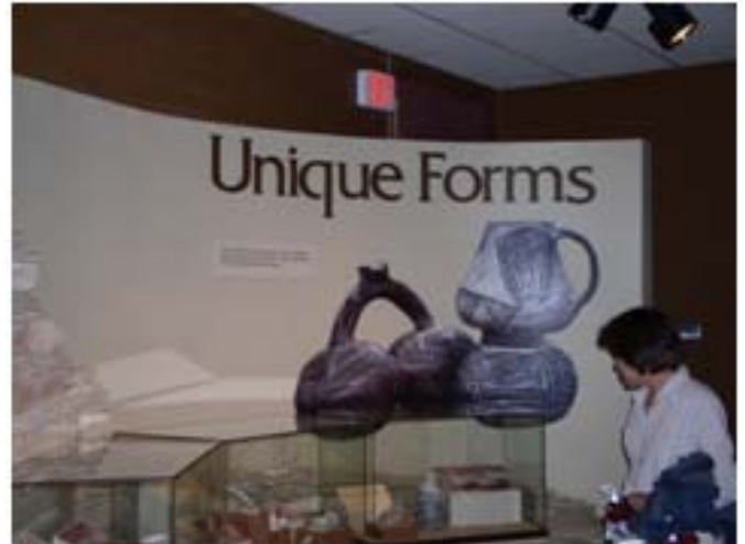
사진 2. Visitor Center내의 전시물