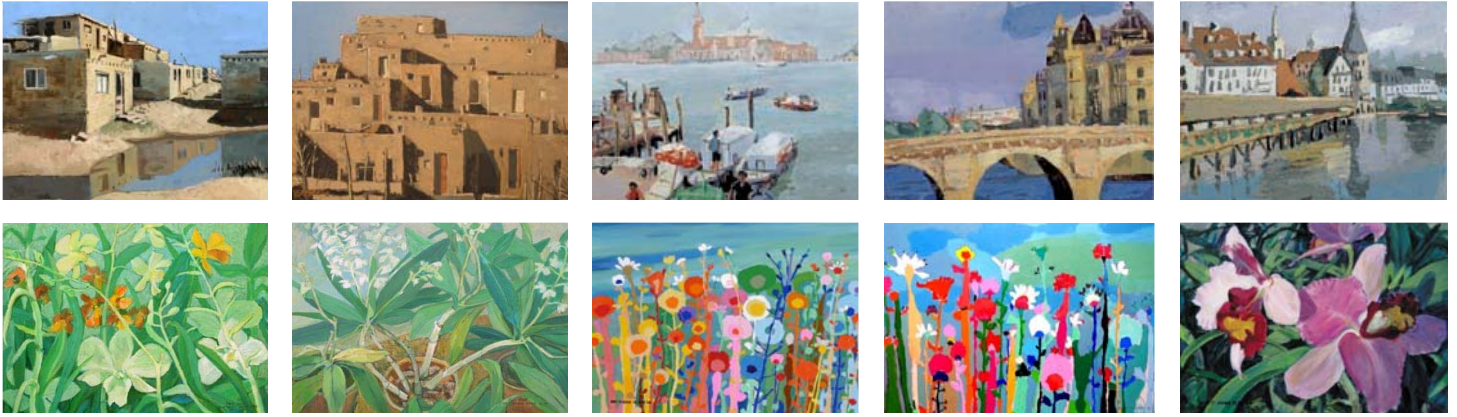
알버커키 박영숙 화가( www.youngsookpark.com )와 김수영 화가( www.geocities.com/hongsooyoungstudio )의 작품들입니다.