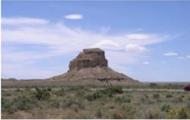
사진 3. 태양관측에 쓰인 Sun Dagger가 있는 Fajada Butte.

을 위해서 일반 여행객의 접근이 금지된 곳이다. 이곳은 당시의 천문관측의 유적이 있는 곳이다. 해의 위치에 따른 돌판사이로 비치는 그림자의 이동을 관측하여 동지와 하지, 춘분 추분을 알아내는 나선형의 Petroglyph가 있는데 이를 Sun Dagger라고 부른다. 현장에는 갈수가 없지만 Visitor Center에서 상세하게 설명된 자료를 볼 수 있다.