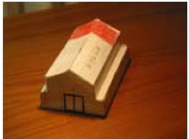
우리교회 성전 모형도 높이20' x 넓이32x 길이48 ( 이모형도는 2002년 6월에 착공했을 때 만든 것임 )

그건 그렇고 우리들이 이 부지에다 새 성전을 건축 할 때 대략적인 생각은 있었지만 성전의 크기를 얼마를 해야 하고, 천정 높이는 얼마로 해야 한다고 정하지 않았다. 중요한 점은 교인 120명이 앉을 수 있게 하라고 건축업자에게 말했었다. 이렇게 시작된 건축이 2002년 6월에 착공 되었고 1년 후에 완공 된 것이다. 그런데 희한한 사실 하나가 우리교회 예배실에 감추어져 있음을 뒤늦게 알게 되었다. (모형도를 참고 하세요)